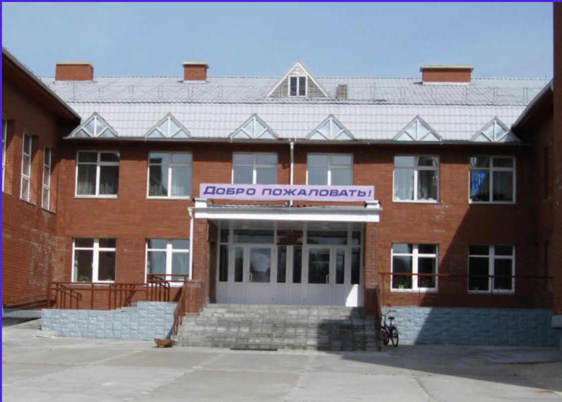
Здание современной школы