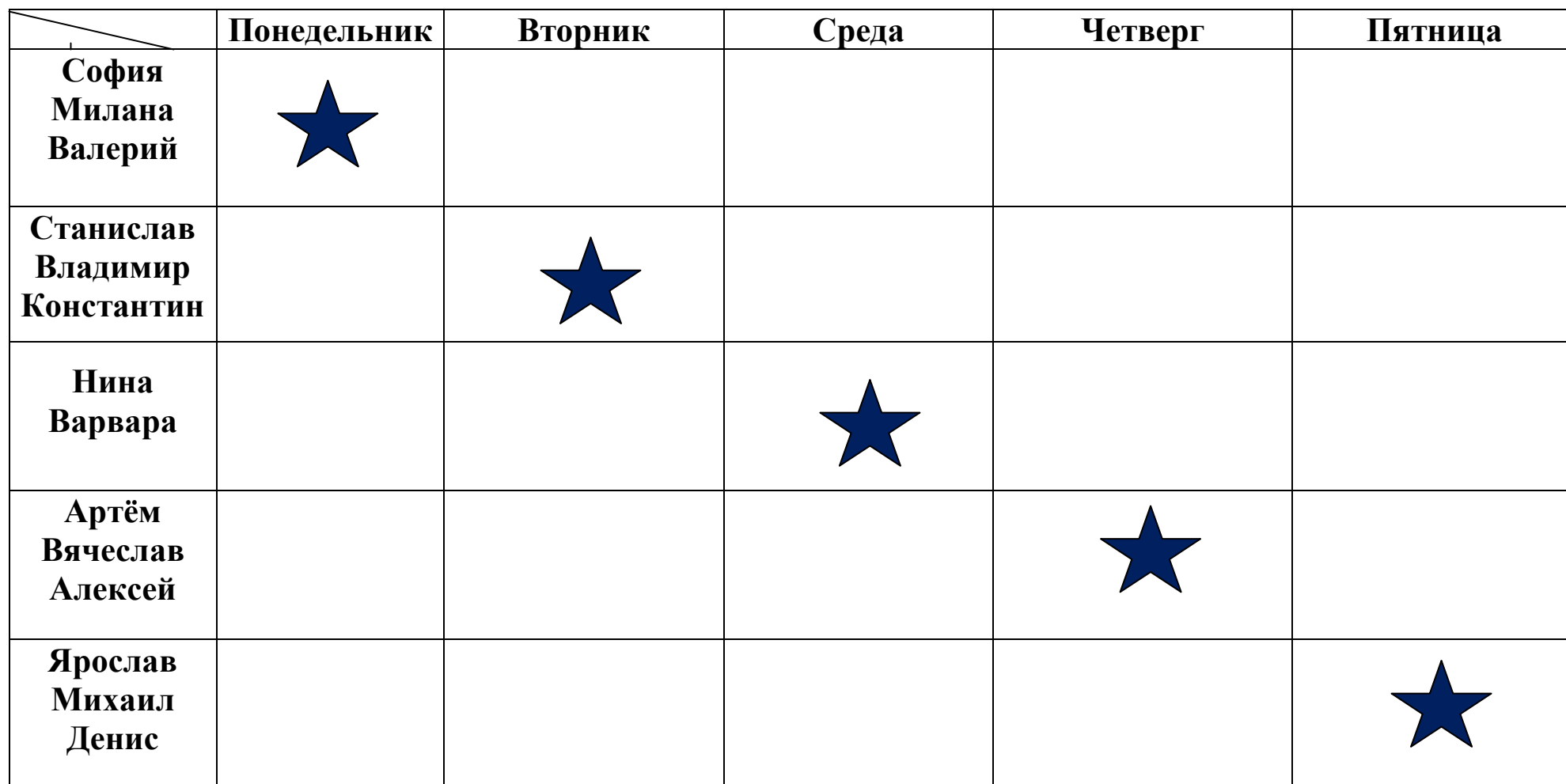
График дежурства в 7 классе